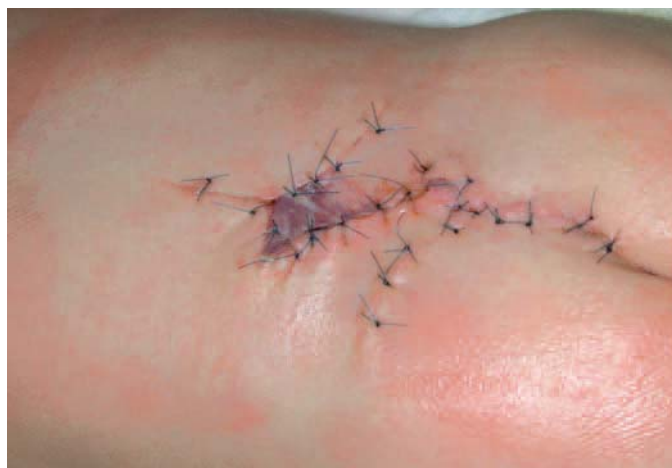
Hautnaht nach Operation einer Spina bifida.